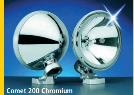
Comet 200 Chromium

La serie DE se compone de los faros auxiliares más pequeños de Hella, para montajes difíciles, adosados o empotrados. Por su carcasa y reflector FF de magnesio se garantiza un amplio rendimiento de luz.