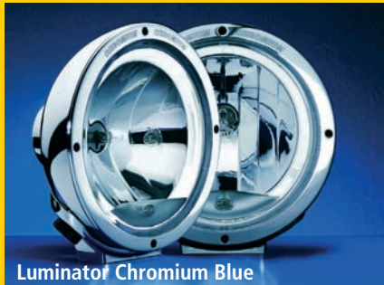
Luminator Chromium Blue

La serie Luminator de Hella se caracteriza por su extremada resistencia. El metal cromado de su carcasa de alta calidad proporciona a este faro una estética muy especial. Dispone de reflector High Boost y dispersor de auténtico cristal en diseño Cool Blue.