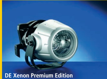
DE Xenon Premium Edition

La serie Luminator de Hella se caracteriza por su extremada resistencia. El metal cromado de su carcasa de alta calidad proporciona a este faro una estética muy especial. Dispone de reflector High Boost y dispersor de auténtico cristal en diseño Cool Blue.