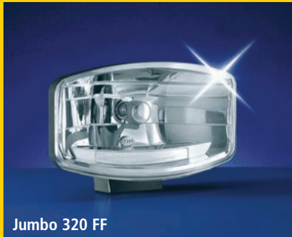
Jumbo 320 FF

Apropiado tanto para vehículos todoterreno como para turismos modernos o clásicos, la línea Comet combina diseño de primera clase (óptica de cristal transparente y reflector FF de alto brillo) con una constante potencia luminosa.